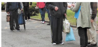
食料の配布に並んだ路上生活者ら＝23日、仙台市

新型コロナウイルスの感染拡大に伴う景気悪化の影響で、仙台市内で路上生活者（ホームレス）が増えつつある。低所得者が職や住まいを失うケースが目立ち、市内の支援団体には若年層からの相談が相次ぐ。関係者は「セーフティーネットからこぼれ落ちる人が出ないよう、生活支援の拡充が必要」と訴える。